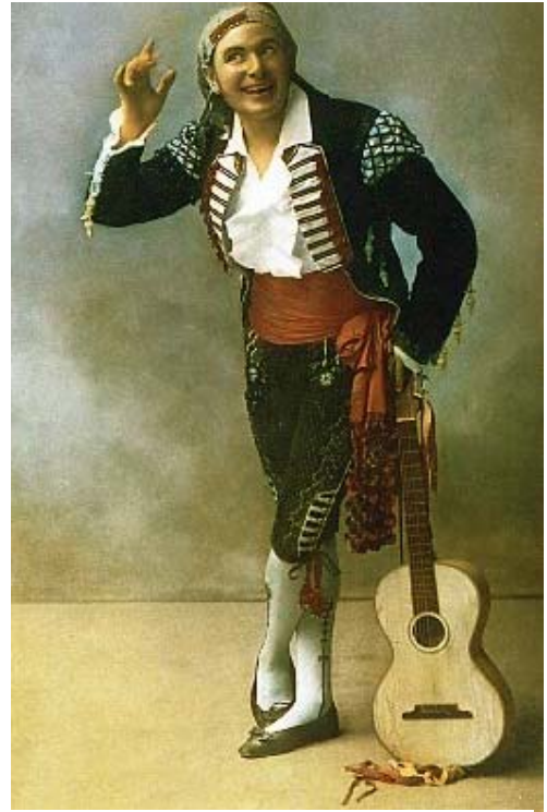
Carlo Galeffi nel ruolo di Figaro