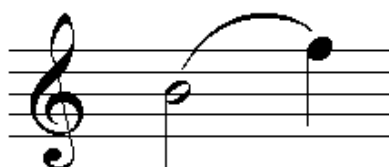
Legatura di portamento

La legatura che unisce due note di diversa altezza non è una legatura di valore. Questa legatura viene detta “ di portamento ” perché suggerisce all’executore un passaggio “portato” senza interruzioni di suono dalla prima alla seconda nota.